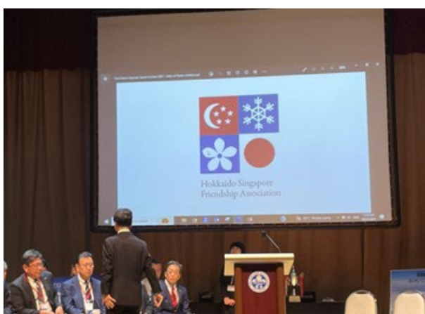
【ロゴマークの紹介】