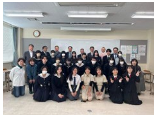
【シンガポール日本語スピーチコンテスト入賞者発表会2023 in とかち 集合写真&交流】