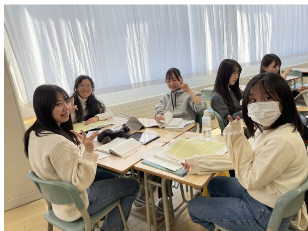
【体験入学（夏目漱石の授業）】