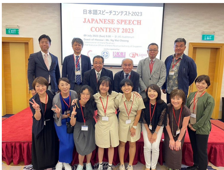
【入賞者との記念撮影】

本年度は、「シンガポール日本語スピーチコンテスト2023」への参加ツアーを実施し、北海道から11名が参加しました。