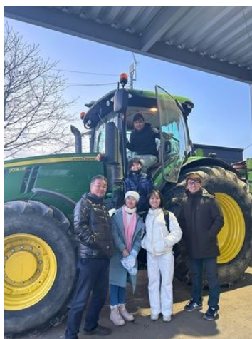
【農業用トラクターに試乗：帯広】