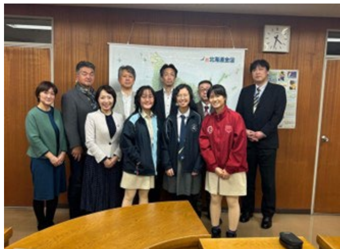
【北海道十勝振興局・十勝教育局】