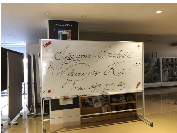
【札幌開成中等教育学校のウエルカムボード】