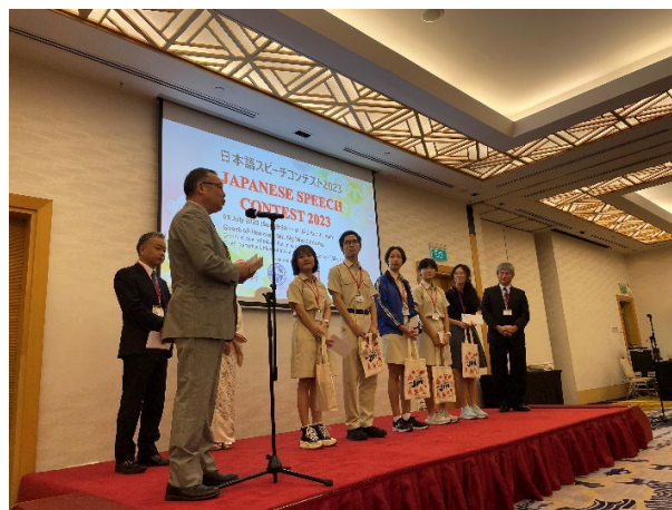
【昼食時に高校の部の参加者に記念品贈呈】