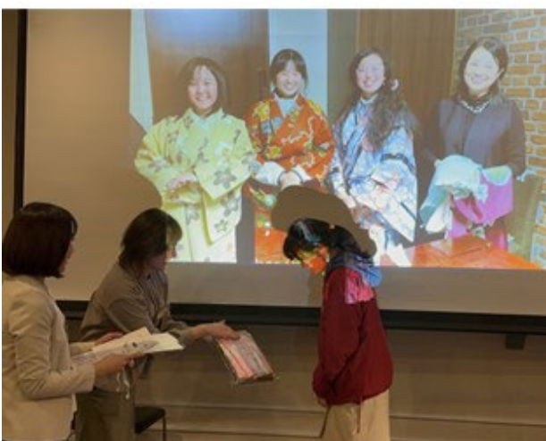
【協会から記念品授与（浴衣や帯）：札幌・函館】