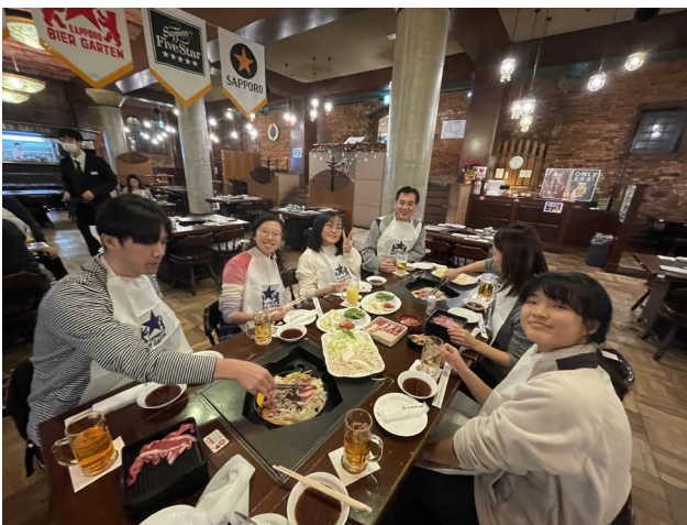
【札幌ビール園（ジンギスカン）：札幌】