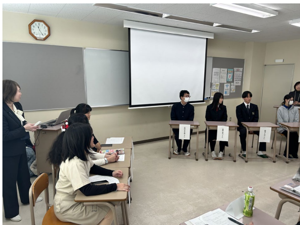
【帯広コア専門学校生と互いの地域紹介】