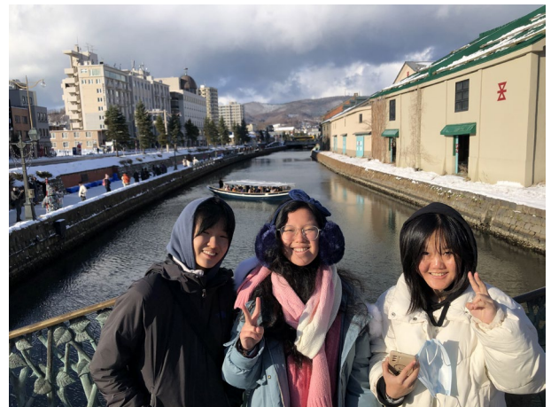
【小樽運河散策と買い物：小樽】