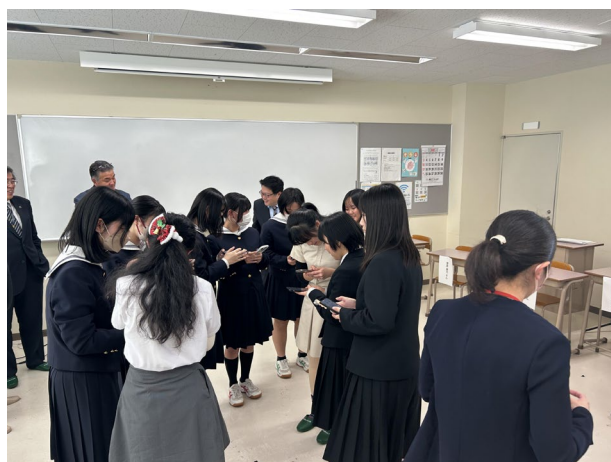
【帯広コア専門学校生と SNS の交換】