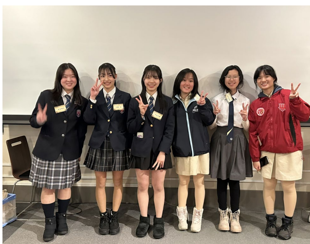
【札幌開成中等教育学校のバディ生徒】