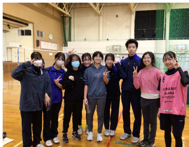
【体験入学（バレーボールの授業）】