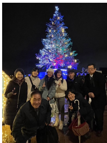
【函館クリスマスファンタジー：函館】