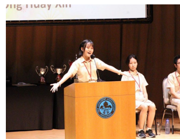
第3位 オン・フェイスン 「二重まぶたの有無」