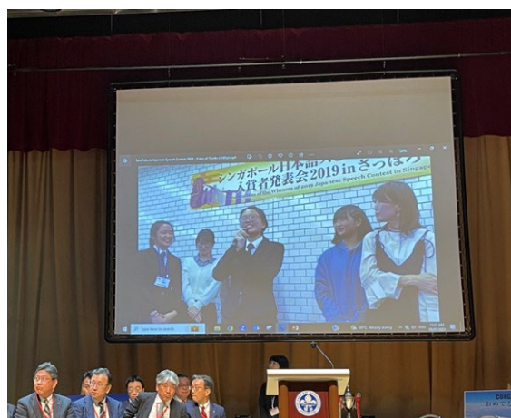
【昨年の北海道での様子を動画で紹介】