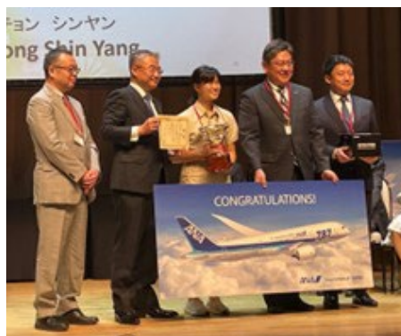
【木本会長代行より目録の贈呈】