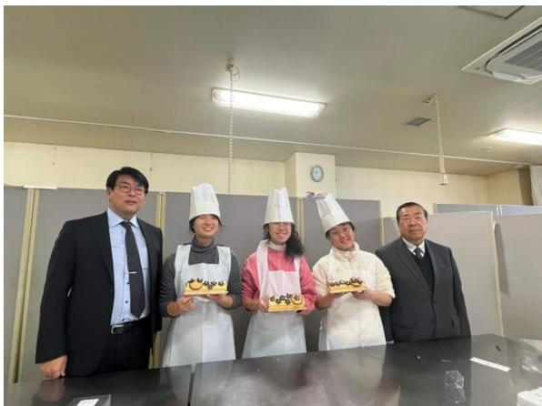
【菓子メーカー「柳月」チョコレートづくり体験：帯広】