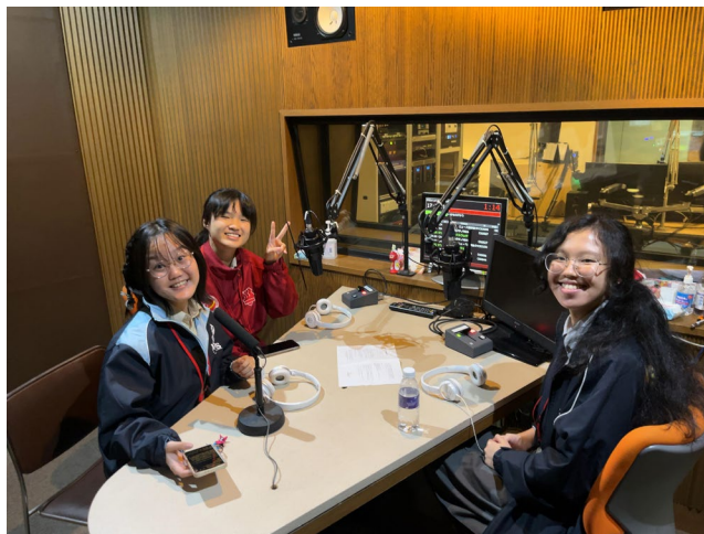
【ローカルラジオへの出演：帯広】