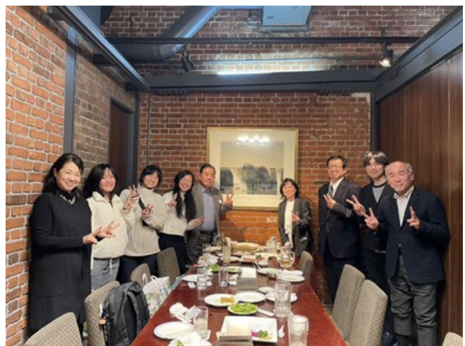
【懇談会】函館市役所との懇談会

函館市役所の観光部局の方と今後のシンガポールとの交流について、夕食をとりながら懇談会を開催した。